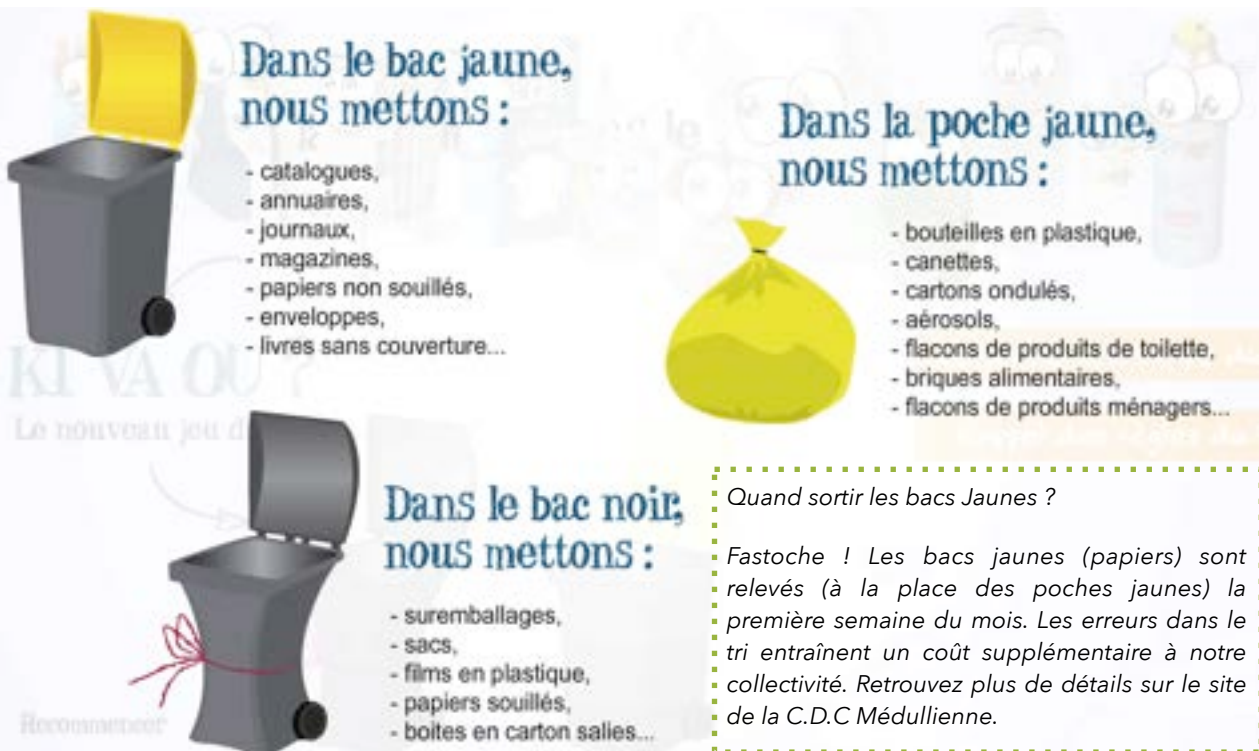
Image extraite du jeu interactif disponible sur le site : cdcmedullienne.fr (rubrique « Environnement / Tri sélectif »)